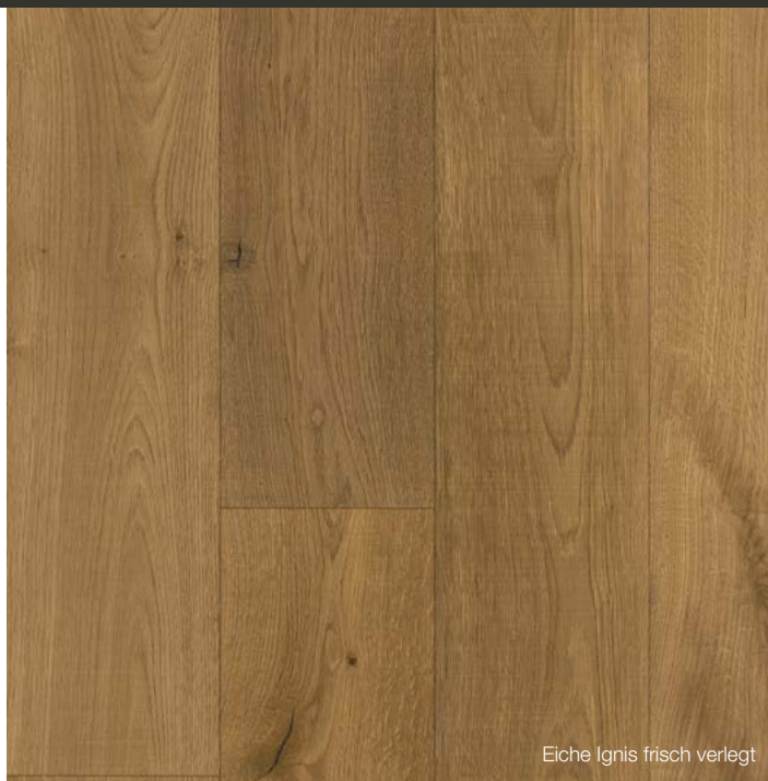
Eiche Ignis frisch verlegt